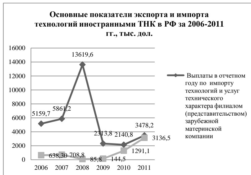
Рисунок 3. 1 – Основные показатели экспорта и импорта технологий иностранными ТНК в РФ за 2006-2011 гг., тыс. дол.